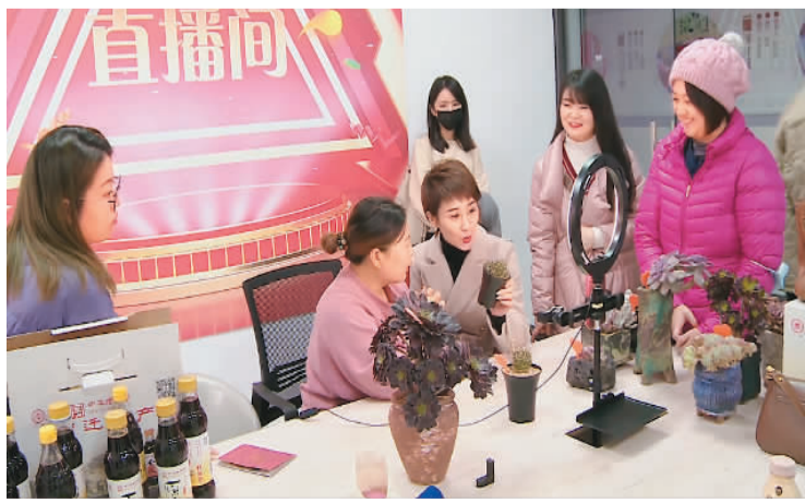
在“台商走电商”实践中，宿迁市举办台湾青年电子商务培训班，培训班老师现场指导直播带货，提升台青实践能力。

据了解，今年一季度，台商在江苏的投资势头依然强劲，苏台贸易额达164.7亿美元，同比增长21.8%，占两岸贸易额的近20%，占江苏全省外贸总额的8.3%。与会人士认为，这显示出台商继续看好在江苏的发展前景、看好苏台经济合作的双赢局面。