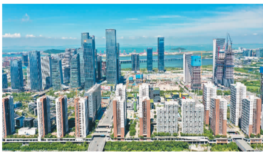
近年来，深圳前海成为许多港澳青年在粤港澳大湾区内地城市就业创业的第一站。图为前海合作区内地城市就业创业的新兴片区。

随着“大湾区青年就业计划”等一系列支持措施的落地实施，越来越多的港澳青年将登上大湾区的“大舞台”，在这里实现梦想。