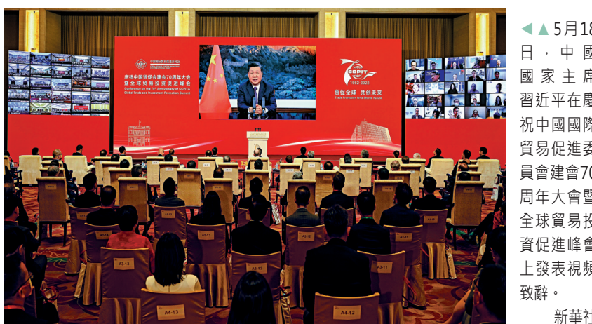
▲5月18日，中國國家主席習近平在慶祝中國國際貿易促進委員會建會70周年大會暨全球貿易投資促進峰會上發表視頻致辭。