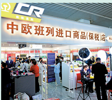
◆福州民衆在中歐班列進口商品(保稅)店購物。資料圖片

習近平強調，中國擴大高水平開放的決心不會變，中國開放的大門只會越開越大。中國將持續打造市場化法治化國際化營商環境，高質量實施《區域全面經濟夥伴關係協定》，推動高質量共建「一帶一路」，為全球工商界提供更多市場機遇、投資機遇、增長機遇。讓我們攜起手來，堅持和平、發展、合作、共贏，共同解決當前世界經濟以及國際貿易和投資面臨的問題，一起走向更加美好的未來。