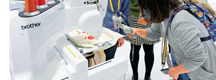
◆去年舉辦的第四屆中國國際進口博覽會上，觀衆在日本Brother集團展台參觀。資料圖片

香港文匯報訊 綜合中新社、新華社及中通社報道，美國總統拜登將於5月20日至24日出訪韓國和日本，這是拜登上任以來首次亞洲行。