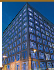
◆斯圖加特市立圖書館外觀。

德國斯圖加特市立圖書館建築外觀呈立方體，內部採用中空設計，書櫃放置在四周，中空部分用錯位的樓梯連接，營造出獨特的空間感和設計感，自2011年建成後成為當地的文化名片和眾多遊客的「打卡」地點。