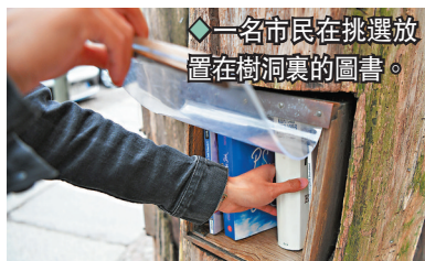
◆一名市民在挑選放置在樹洞裏的圖書。