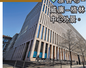
◆雅各布-威廉-格林中心外景。

雅各布-威廉-格林中心命名自德國學者和作家格林兄弟，於2009年10月正式啓用為德國柏林洪堡大學的主圖書館，約有250萬冊藏書，其中約200萬冊可供讀者借閱。由多層階梯式閱讀區、柵格狀牆面和頂部天窗構成的中心區域是雅各布-威廉-格林中心的一大特色。