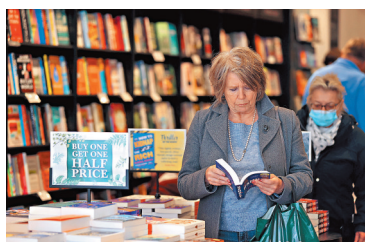
◆一位讀者在英國斯特拉特福的一家書店內看書。

4月23日是聯合國教科文組織 (UNESCO) 擬定的「世界閱讀日」，在這個科技飛速發展的時代，閱讀的含義越發廣闊，成就了各式各樣的閱讀方式，但也同時讓傳統閱讀陣地受到不同程度的衝擊。除了香港的二手書店各憑特色尋覓生存空間，內地及外國的書店和圖書館也紛紛找到了多元發展之路。藉此專題，我們將展現香港、內地及外國「城市書房」的現狀及美景，介紹獨立書店店主的經營之道，亦講述從垂髫稚童到耄耋老人在書中找尋到「讀家樂趣」的故事。