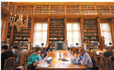
◆人們在馬扎然圖書館內閱讀。

馬扎然圖書館位於法國巴黎塞納河左岸的法蘭西學院內，創建於17世紀，是法國最古老的公共圖書館，也是擁有法國最豐富珍本書籍和手稿的圖書館之一。