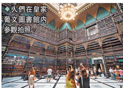
◆人們在皇家葡文圖書館內參觀拍照。