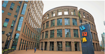
◆溫哥華公共圖書館中央圖書館大樓。

溫哥華公共圖書館的中央圖書館大樓坐落於溫哥華市中心，以古羅馬競技場為靈感設計，於1995年5月26日落成啓用。