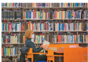
◆讀者在溫哥華公共圖書館中央圖書館內閱讀。