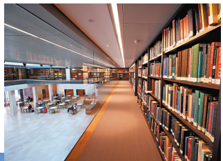
◆博德利圖書館內景。

牛津大學博德利圖書館始建於1602年，是歐洲最古老的圖書館之一，有400多年歷史，館內擁有超過1,300萬件館藏，被錢鍾書戲稱為「飽蠶樓」。