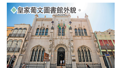
◆皇家葡文圖書館外景。

巴西皇家葡文圖書館由葡萄牙建築師拉斐爾·達席爾瓦·卡斯特羅設計，建於1880年至1887年間，採用新曼努埃爾設計風格。這座圖書館自1900年開始向公眾開放，收藏有超過35萬卷葡萄牙語書籍與作品，是目前葡萄牙以外收藏最多葡語書籍和作品的圖書館。館內彩色玻璃穹頂、枝型吊燈和木製書架設計精美，每年吸引大量遊客前來參觀。