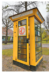
◆柏林北部呂巴斯社區文化中心對面街心綠地的書刊亭。

然而，那些在樹洞、電話亭、塑料箱暫時安身的書，雖無精美包裝，但正如杜斯曼書店的海報所言，「評判一本書，不是只看封面」。