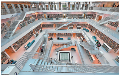
◆人們在德國斯圖加特市立圖書館內參觀及閱讀。