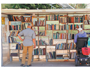
◆市民在耶路撒冷的街邊圖書館選書。

耶路撒冷有多處街邊圖書館，為人們提供免費的圖書閱覽服務。街邊圖書館的圖書大多來自機構或個人捐贈，根據語種和類別被有序放置在書架上。各個街邊圖書館的具體位置信息可在耶路撒冷市政網站查詢，方便人們就近選擇。