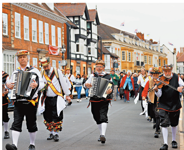
◆人們在斯特拉特福參加莎士比亞紀念活動。