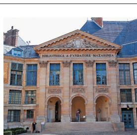
◆馬扎然圖書館外景。