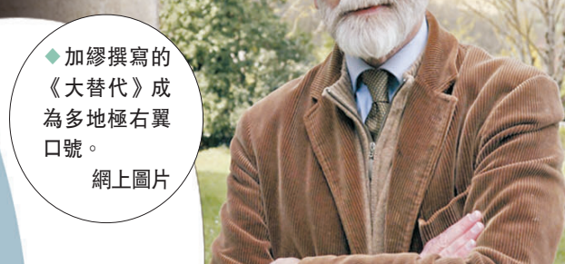
◆加繆撰寫的《大替代》成為多地極右翼口號。網上圖片