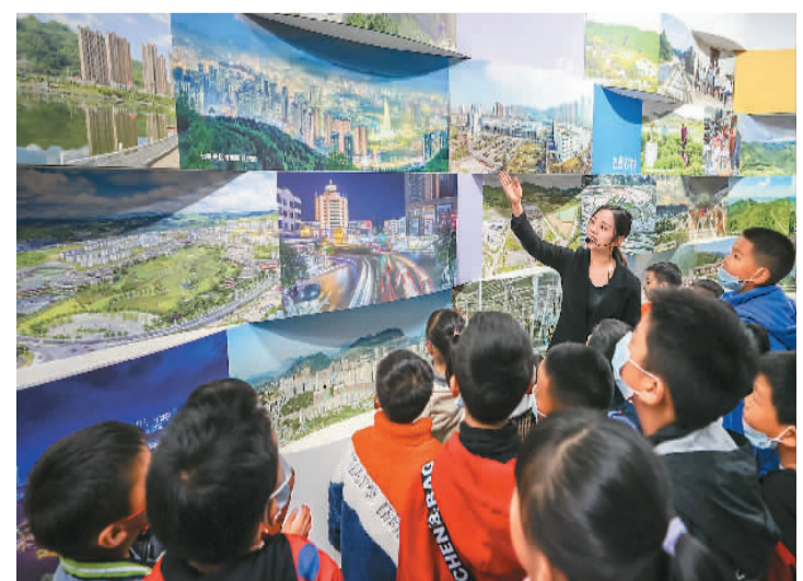
在“国际博物馆日”即将到来之际,贵州省毕节市的一些家长带着孩子走进毕节市博物馆,通过参观、互动体验,深刻感受当地丰富、独特的历史文化。因为讲解员在为小朋友介绍毕节发展史。

本报乌鲁木齐5月15日(阿尔达克、周海霞)来自阿尔金山国家级自然保护区管理局的消息:随着保护区管护力度的加大,藏羚羊、野牦牛、藏野驴三大高原珍稀物种数量大幅增长,目前已突破11万头(只)。 近年来,阿尔金山国家级自然保护区管理局持续同科研院所合作,运用无人机、红外相机,采用巡护样线统计等方法,对三大物种种群数量进行监测。截至今年4月,监测发现,同10年前相比,藏羚羊由4.3万只增加至4.95万只,野牦牛由0.9万头增加至1.2万头,藏野驴由3.8万头增加至5万余头,保护区三大物种野生动物数量呈现上升态势。 “在保护区几代人的努力下,高原生态系统完整性和原真性得到有效保护。”阿尔金山国家级自然保护区管理局党委书记、副局长孟凯说,阿尔金山国家级自然保护区管理局与三江源国家公园、西藏羌塘国家级自然保护区及当地政府深化合作,守护青藏高原北部重要的生态安全屏障。 据介绍,在阿尔金山国家级自然保护区,三大高原珍稀物种野生动物适宜栖息地面积2.53万平方公里。除藏羚羊、野牦牛和藏野驴外,阿尔金山国家级自然保护区还有雪豹、黑颈鹤等珍稀野生动物338种。其中,国家一级重点保护野生动物17种、国家二级重点保护野生动物31种。