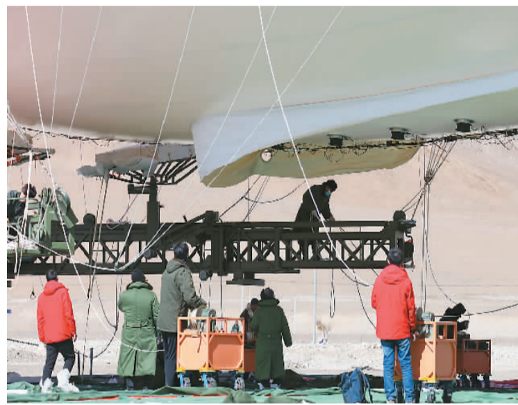
科考队员在调试“极目一号”Ⅲ型浮空艇。

种类在已知的高原型系留浮空艇中前所未有。 此次“极目一号”Ⅲ型浮空艇挑战观测高度海拔9000米,难点颇多。首先,9000米海拔低温低压高风速环境条件下对系留浮空艇平台的可靠性提出了严苛的要求;第二,本次系留浮空艇的艇体材料,是一种由我国自主研发的轻质低密度高强抗辐射复合织物材料,在珠峰地区严苛的环境条件下应用尚属首次,具有重大的科学研究和工程应用意义;第三,海拔9000米高度的复杂电磁环境、低温低气压高风速的环境条件对系留浮空艇的艇体、控制系统、能源系统以及锚泊系统的稳定性都提出了巨大考验。设计人员从技术角度和现场试验有力地回答了这些问题,交出了满意的答卷。 本次浮空艇科考队由来自中科院青藏高原研究所、空天信息创新研究院、长春光机所和中电科八所等单位的63名科考队员组成。