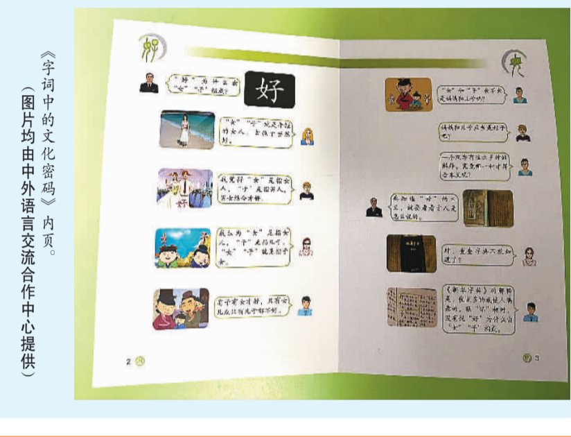
《字词中的文化密码》内页。