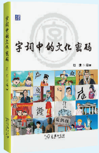
《字词中的文化密码》书影。