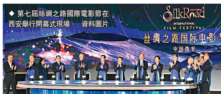
◆第七屆絲綢之路國際電影節在西安舉行開幕式現場。

據了解，第九屆絲綢之路國際電影節參評影片報名截止日期為2022年7月31日24時，報名截止後遞交的報名將無權參賽，已報名影片不可撤回報名。此外，電影節亦接受報名影片樣片線上觀看鏈接。