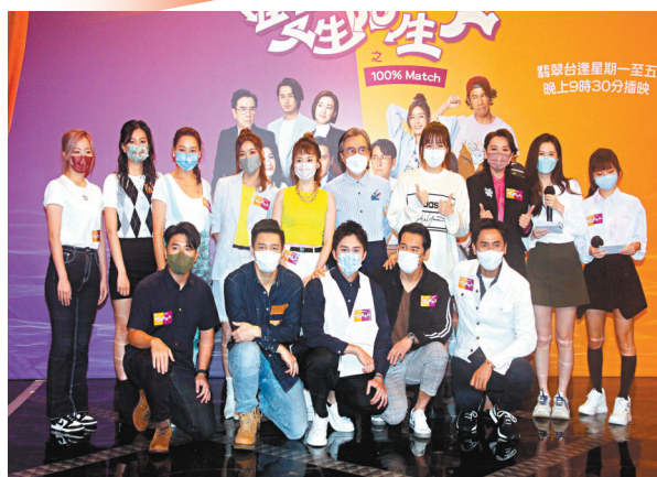
◆《雙生陌生人》收視不似預期。