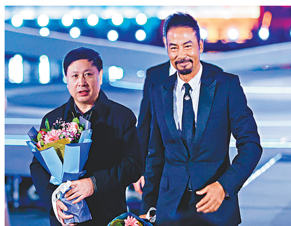
◆任達華(右)出席第八屆絲綢之路國際電影節在福建福州的開幕儀式。資料圖片

香港文匯報訊(記者 李陽波 西安報道)第九屆絲綢之路國際電影節擬於9月在陝西西安舉行。電影節(西安)執委會日前(10日)發布消息，從當日起，本屆電影節競賽單元正式面向全球徵片，報名影片可通過絲綢之路國際電影節官方網站進行在線申報，影片報名截止日期為今年7月31日24時。據悉，去年12月8日至12日在福建福州舉辦的第八屆絲綢之路國際電影節，共吸引了來自「一帶一路」沿線42個國家和地區的500多部影片參評。最終，來自波蘭和愛爾蘭的合拍影片《我從不哭泣》摘得最佳影片大獎。