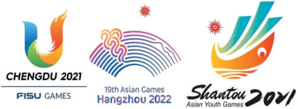
世大運、亞運可延期，但亞青運取消。

項奧運測試賽及奧運計分賽。巴黎奧運會於2024年7月26日至8月11日舉行，2023年9月離巴黎奧運不足一年，那一定影響運動員備戰奧運及爭取奧運入場券，屆時相信國際各項總會賽事也不會遷就亞運會，便很有可能導致各地區均派非主力運動員參加亞運會，留主力運動員迎戰巴黎奧運，這就十分影響亞運的可觀性了。 除了對運動員影響大外，其實亞運延期對經濟影響也很大，資料顯示2010年廣州亞運會投資達1,200億元人民幣，相信今屆亞運總支出不會少過廣州亞運會，這個經濟損失由誰來負擔呢？東京奧運會延期一年，大會與68個贊助商商贊助金額由合共33億美元追加至37億美元，但亞運贊助商不會妥協多增加贊助金呢？亞運贊助商大部分是中國品牌，在疫情之下，很多企業經濟也受影響，相信再難多加贊助，加上亞運電視版權費跟奧運版權費天淵之別，收入完全幫助不到電視製作，正如香港電視台轉播亞運，一定虧本。 疫情之下，沒有人知道什麼事情會發生，亞運相信不會延期一年，或可能在明年四五月比較合理，希望亞組委會也好，奧委會也好，各國各地區體育總會也好，能夠達成一個以各國運動員的利益為前提考量的共識吧！