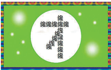
它不是繁體，只是「煩」體。

用到了「剛纔」一詞，那個23劃的「纔」字，可真是繁體中最累贅的頑石，礙眼得很，最初以為是「才」字的繁體，原來不然，之前絕對想不到它還是在繁體「手」字部才查得出來，《說文解字》中解說「才」字第一劃代表地平線，往後一撇寓意為草之根，也就是剛發芽的草，比草還來得早，由此證明「剛才」絕對正確；至於「纔」，是指黑中帶紅的織物，《說文解字》稱為「帛雀頭色」。 此外「表」字也常給人誤為「錶」的簡體，殊不知「手錶」的「表」字原意是指「時間表」，並無需要強調它製自五金，可知有些簡體也是來自繁體。 看來今後「一字兩制」或者「兩制一字」已是必然趨勢，而且用得正確，中文越豐富，已無必要分繁簡。