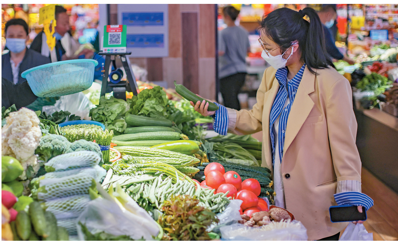
◆4月中國居民消費價格指數（CPI）同比上漲2.1%，高於3月0.6個百分點，2021年12月以來首次突破2%。圖為5月11日江蘇南京市民在太平農貿市場內選購蔬菜。