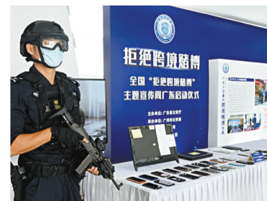
◆ 全國「拒絕跨境賭博」主題宣傳周去年在廣州舉行。 資料圖片

為深化跨境賭博專項治理打擊行動, 國家移民管理局立足職能任務, 嚴把出入境證件簽發管理關, 強化詢問核查, 對涉賭犯罪嫌疑人等具有法定不准出境情形人員, 依法不予簽發出入境證件, 對一批跨境賭博人員依法宣布其所持出入境證件作廢, 最大限度將參賭涉賭人員管控在境內。