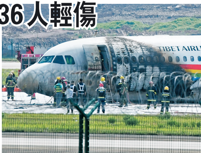
◆ 12日上午, 西藏航空一航班在重慶江北國際機場起飛時出現異常偏出跑道, 飛機起火。圖為重慶江北國際機場事故處置現場。 中新社

航班數據服務軟件「航旅縱橫」顯示, 5月12日執飛西藏航空TV9833航班的是一架註冊號為B-6425的空客A319-100, 機齡9.5年。重慶江北國際機場5月12日上午出現一定規模取消、延誤情況。目前, 重慶江北國際機場航班起降恢復正常。事故原因正在調查中。