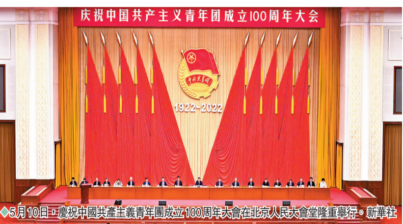
5月10日，慶祝中國共產主義青年團成立100周年大會在北京人民大會堂隆重舉行。