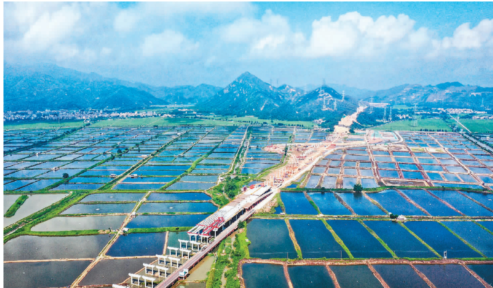
5月6日，广东省江门市黄茅海跨海通道建设现场。该通道建成通车后，将与港珠澳大桥、深中通道、南沙大桥、虎门大桥共同组成粤港澳大湾区跨海跨江通道群。

“全面加强基础设施建设”，近期在多个中央层面会议中出现，成为观察中国的重要关键词。