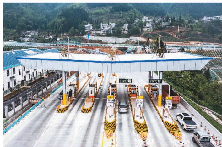
4月22日，由贵州交建集团承建的赫（赫章）六（六盘水）高速公路正式建成通车。

近日，浙江省交通强省建设领导小组办公室印发《浙江省交通运输新型基础设施建设“十四五”实施方案》，明确提出总体目标，到2025年，全省交通新基建总投资规模超1500亿元，交通新基建总体架构基本形成，基础设施、运输服务和智能装备向要素、全周期数字化升级，成为全国交通新基建先行区。