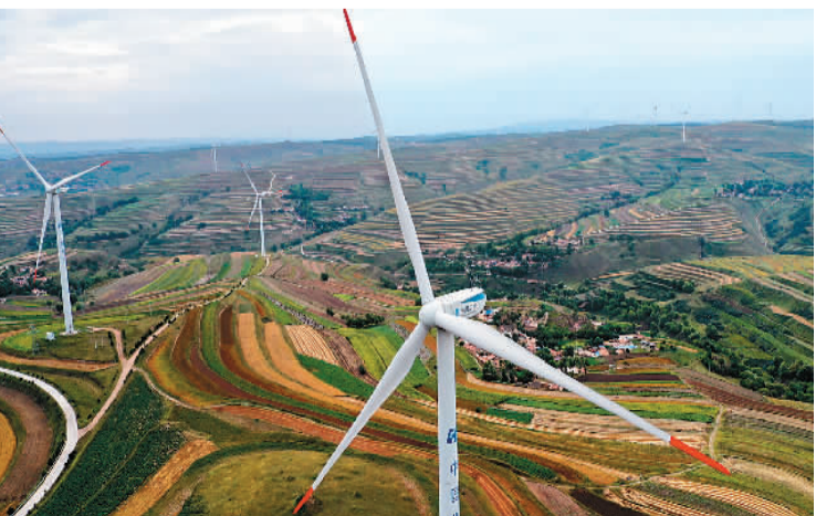
位于甘肃省定西市通渭县华家岭的梯田与风电机组。