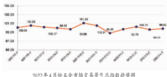
2022年4月份五金市场交易景气指数趋势图

4月份，永康五金市场交易景气指数为99.82点，环比上升0.21点。十二大类行业景气指数呈现八升四降格局。结构性指标呈现不同程度波动，其中，要素供给景气指数环比上升17.13点，市场需求景气指数环比下跌5.58点，运营效益景气指数环比下跌3.47点，总体判断景气指数环比下跌2.82点。