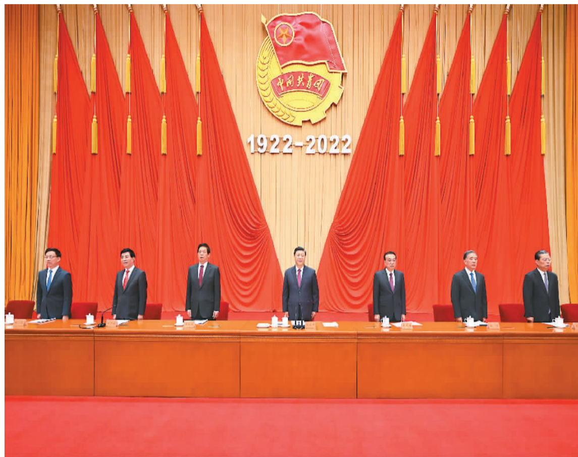
5月10日,庆祝中国共产主义青年团成立100周年大会在北京人民大会堂隆重举行。中共中央总书记、国家主席、中央军委主席习近平在大会上发表重要讲话。