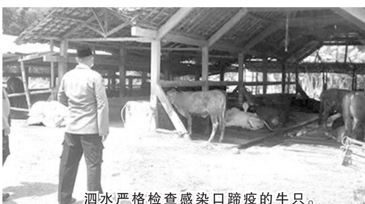
泗水严格检查感染口蹄疫的牛只。

尤里尤斯表示，牛只的运送需要一个过程，如饲料准备、建议、健康检查等。已经从古邦送来的牛只再也无法归还了。牛只将通过公路运往雅加达。但由于病毒，它被困在了泗水丹绒北腊港，不能再返回古邦。 东爪哇是我国第一个发现牛只口蹄疫病例的地区。因此，当地政府随后颁布了一项规则，禁止牛群进出该地区。 尤里尤斯称道，我们仍与泗水的牲畜检疫中心