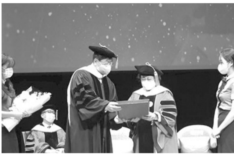
梅加瓦蒂荣获韩国首尔首尔艺术大学(SIA)授予荣誉教授封号。

平特使，以实现韩国与朝鲜之间的持久和平。 梅加瓦蒂欣然接受了这个请求。 达胡立表示，梅加瓦蒂建议，为了两国之间的永久和平，应该优先考虑心连心的方法或兄弟情谊。 韩国执政党人民力量党领导人之一的金锡基在会上表示，韩国政府和人民将梅加瓦蒂视为重要的世界人物，能够在不久的将来促进韩国与朝鲜之间实现永久和平。 梅加瓦蒂被认为是朝