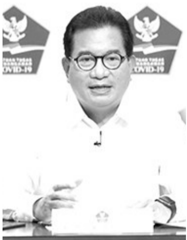
处理新冠肺炎的特别工作组发言人威酷。

【本报讯】5月10日(星期二)，处理新冠肺炎的特别工作组发言人威酷(Wiku Adisasmito)声称，希望长途出行或访问过拥挤地点的民众，立即进行新冠肺炎测试。尤其是，如果民众开始感觉到已感染上新冠肺炎的症状。 威酷提醒民众必须意识到我国仍然面临新冠肺炎大流行。在新冠肺炎大流行期间，必须保护某些群体免受新冠肺炎传播。我再提醒大家，不要让我们被感染，成为我们周围