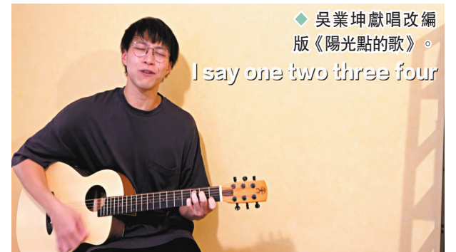
◆吳業坤獻唱改編版《陽光點的歌》。