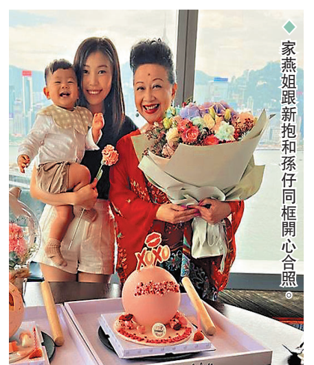
◆家燕姐跟新抱和孫仔同框開心合照。

此外,在「基地」中的《家燕演藝繽紛60年》,家燕姐就親身講述在70年代的,曾到菲律賓作巡迴表演時,遇上槍擊事件逃出生天的經過,該環節每周都會作出更新。