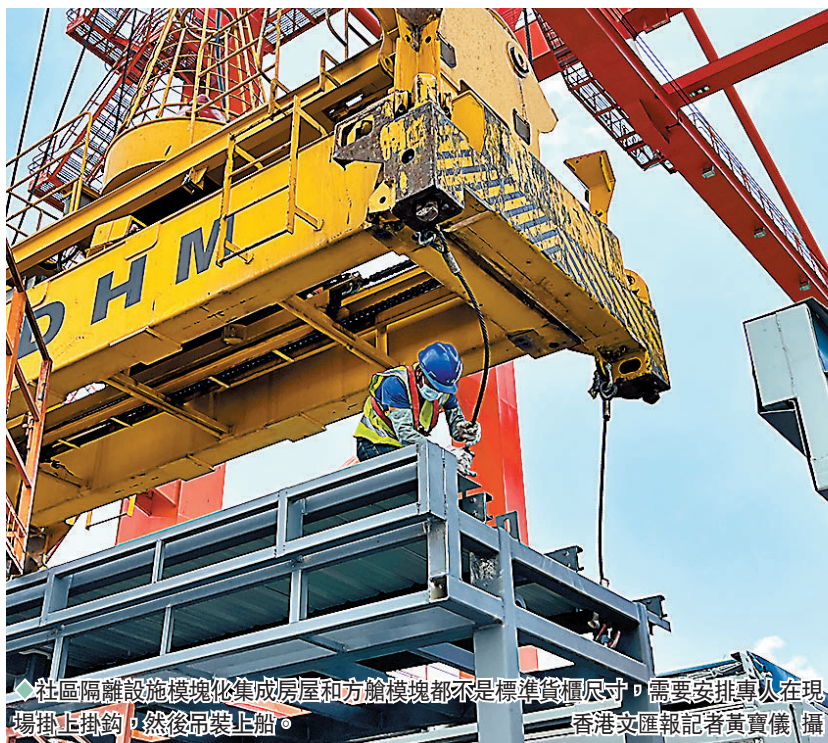
社區隔離設施模塊化集成房屋和方艙模塊都不是標準貨櫃尺寸，需要安排專人在現場掛上掛鈎，然後吊裝上船。

上二維碼，司機裝車時用手掃下二維碼，將相關數據信息提前發到港口的系統，車輛通過自動開口後，系統會自動採集相關信息並發出指令，引導車輛到指定位置卸貨。貨物由駁船運達香港後，香港碼頭能根據江門高新港的預報信息、中建現場工地的裝配要求信息，有序安排MIC箱運放至合適的位置或地點，極大提高香港現場工地的裝配效率。