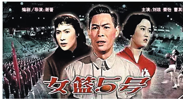
◆秦怡(左)飾演《女篮5号》中樂觀的林潔。