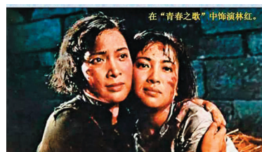
◆秦怡(左)在《青春之歌》裏飾演慷慨赴死的女戰士林紅。