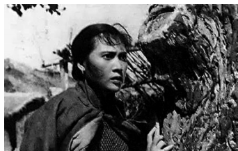
◆秦怡在《鐵道游擊隊》中飾演芳林嫂。