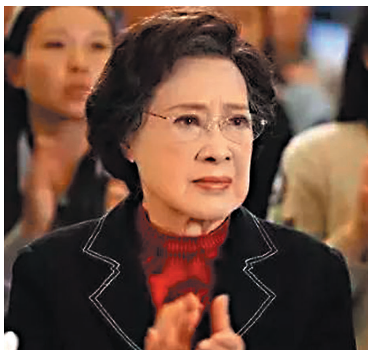
◆《青海湖畔》劇照。當時93歲的秦怡演繹女氣象工程師梅欣怡。

上海文學藝術獎為秦怡頒發終身成就獎時的頒獎詞這樣寫道：「秦怡始終活躍在大時代的洪流中，她像疾風中綻放的玫瑰，以歲月無法改變的不老美麗風采，感動着每一個中國人。」