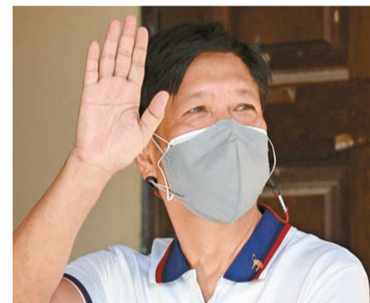
小馬可斯在投票後向支持者揮手。

為確保投票順利，政府出動數以千計軍警戒備，以防爆發暴力衝突。南部馬京達瑙省一個票站昨天上午遭到襲擊，3名警察死亡。據悉，襲擊事件發生在該省布盧安市，襲擊者駕駛兩架白色貨車，到一間被劃定為票站的小學外，向維持秩序的軍警開槍，導致3名警察死亡，一人受傷送院。當局認為這次襲擊與選舉投票有關，疑犯施襲後逃離現場，安全部門人員正追捕他們。