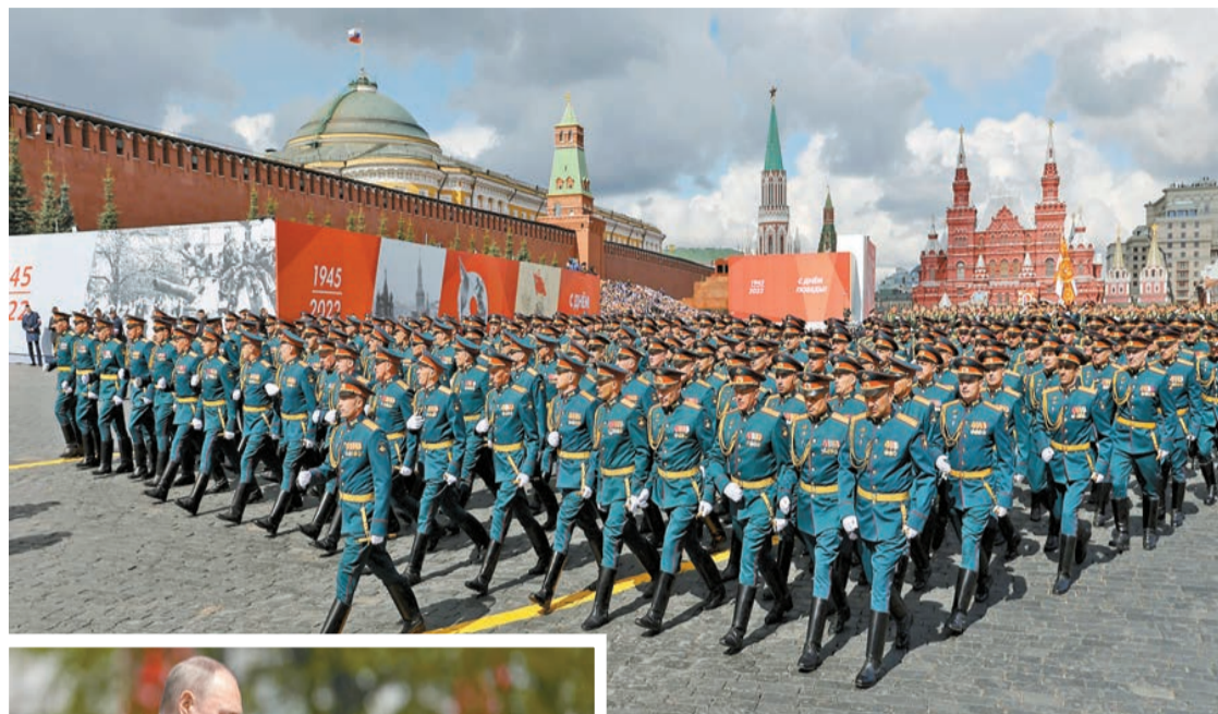
在俄羅斯首都莫斯科，士兵列隊走過紅場，紀念衛國戰爭勝利77周年。

【香港商報訊】俄羅斯昨天在莫斯科紅場舉行衛國勝利日閱兵，紀念在二次大戰戰勝納粹德軍77周年。總統普京發表演說，聲稱北約國家準備入侵俄羅斯的歷史土地，並在烏克蘭東部頓巴斯地區進行另一次懲罰性行動，指北約的不斷擴張伸延到俄羅斯周邊領土，意味俄方與新納粹分子衝突是無可避免，因此俄羅斯先發制人是唯一正確決定。不過普京未有如外界預期，在儀式中正式向烏克蘭宣戰。