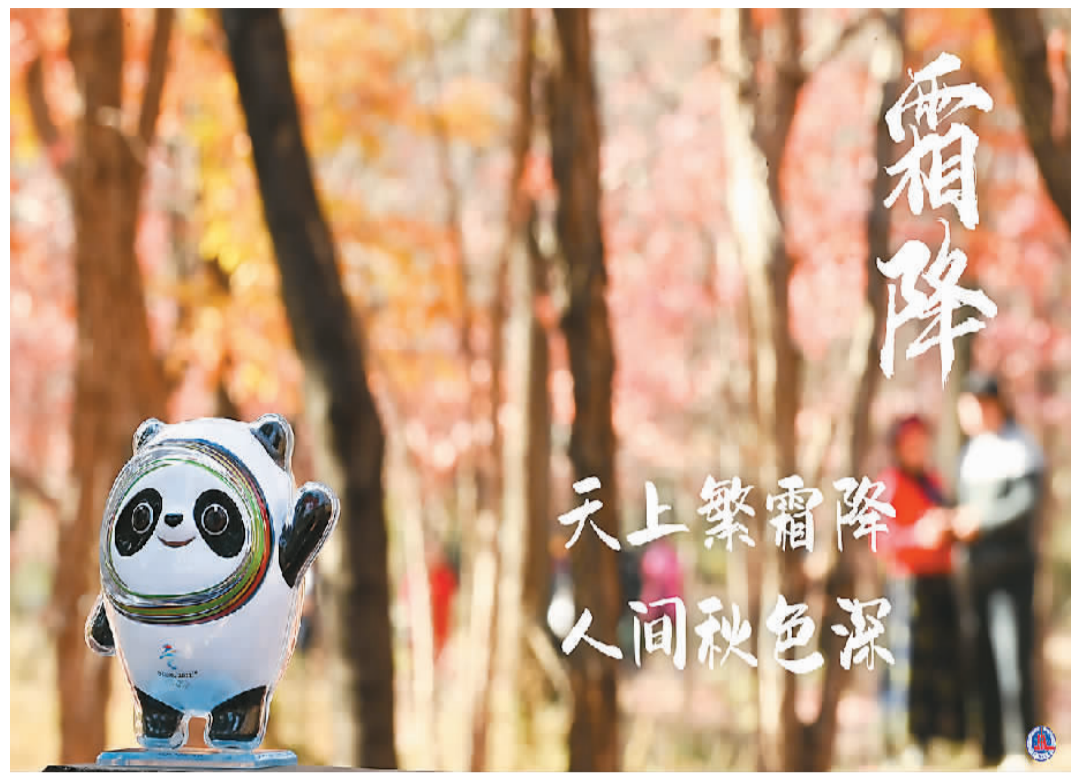
冰墩墩打卡二十四节气·霜降。 颜麟蕴、维圆编制

二十四节气是中国先民认识和改造自然、社会、人生的基本遵循，彰显了中国先民认知宇宙和自然的独特性，对于当今推进绿色发展、建设生态文明具有重要的现实意义。