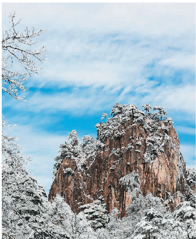
2021年11月22日是二十四节气小雪，安徽省黄山风景区迎来入冬首场降雪，满山银装素裹，在冬日暖阳照耀下，晶莹剔透，宛如琉璃仙境。

二十四节气是中国人通过观察太阳周年运动，认知一年中时令、气候、物候等方面变化规律所形成的知识体系和社会实践，是中国先民在长期的农业生产中，根据天地运行以及气候变化规律创造的时间制度。它不仅是中国人“天人合一”生态思想的体现，也浓缩着因地制宜、因地制宜、循环发展的生态智慧。