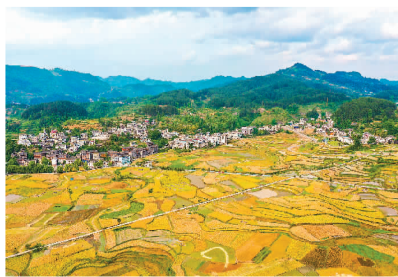
5月8日,贵州省贵阳市开阳县禾丰乡马头村底窝坝色彩斑斓。从空中俯瞰,金黄的油菜与阡陌田园、绿水青山、秀美村庄相映成趣。