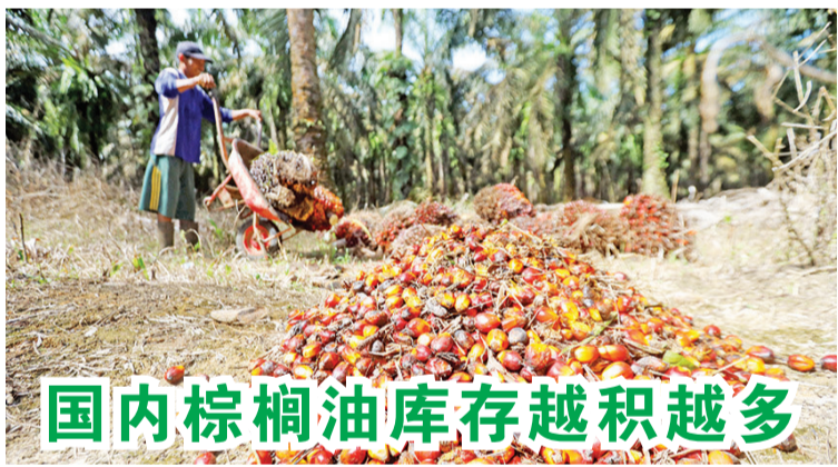
国内棕榈油库存越积越多

印尼人民银行多元金融公司的净利润,在2021年同比增长802.9%。此外,印尼人民银行多元金融公司还推动资产同比增长29.5%至5.24万亿盾,符合公司到2024年的资产达到10万亿盾的目标。(松鹤)