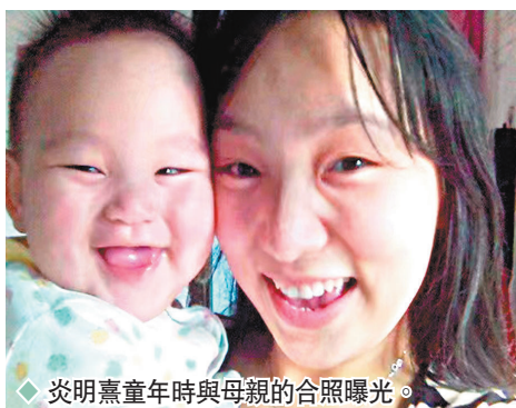
◆炎明熹童年時與母親的合照曝光。