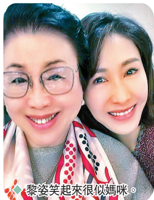
◆黎姿笑起來很似媽咪。