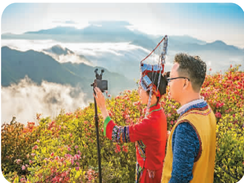
安徽省宁国市云梯乡畚族村民在汤公山直播云海和杜鹃花。

刚回到住处，一场窸窣窣的小雨紧随而至。黄昏时的泸沽湖适合下一场雨，路灯折射下的湖面水花溅起，一朵接着一朵。没过多久雨下大了，满湖的水花像开得密密匝匝的波叶海菜花，让泸沽湖的雨夜更加迷人。雨停后，只剩下铺天盖地的寂静，夜色也把泸沽湖精心包裹起来。我笃定地相信，就在今晚，湛蓝的湖水会迫不及待来到我梦里，来回荡漾。