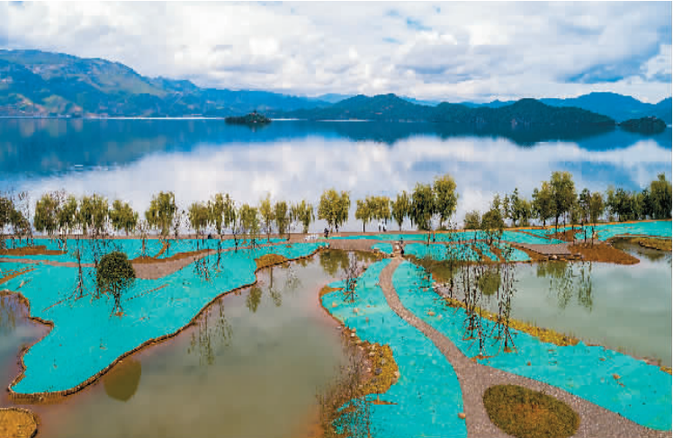
泸沽湖边一处正在建设的湖滨湿地。

进入5月，贵州省六盘水市六枝特区月亮河乡老虎大坪景色迷人，油菜花、白芨、香葱、地参、金丝油菜等农作物和中药材生长繁茂，吸引着周边游客前来赏花观景。当地保护生态环境，发展清洁能源，老虎大坪的光伏电站通过110千伏邵岱变电站并入南方电网，每年为电网提供9万兆瓦时清洁能源。图为贵州省六枝特区月亮河乡老虎大坪风景如画。