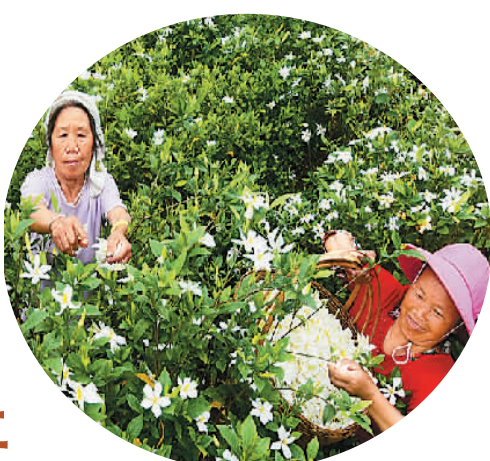
湖南省郴州市嘉禾县村民在采摘栀子花上市。

梯田高垒云烟里，风情人家半山间。在畚乡期间，我们还游览了千秋关古战场遗址、大野洼、花溪谷、太子坑水库、将军关漂流等景点。可谓移步皆是美景，人耳尽有传说。作为位处天目山西北麓、安徽省唯一的一个畚族乡镇，它的确有辜负每一个到来者的期待。