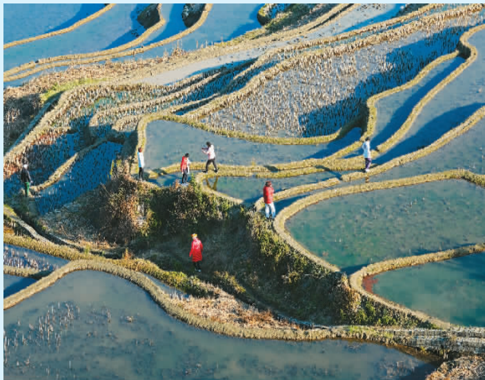
云南省红河哈尼族彝族自治州元阳县新街镇爱春村，游客在梯田里游览。

保护细则的绑定，村子实实在在有了改变：村民们真金白银的分红收入多了，潜移默化了的内生动力增加了，游客们的旅游体验提升了。阿者科村为乡村振兴、传统村落和梯田文化遗产保护，找到了一条可持续发展的旅游发展之路。