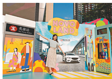
貼心轉乘「巴」，裝置中間更配上耀眼奪目的霓虹燈，營造朝氣蓬勃的健康氣息！

展覽設於戶外 Open Piazza，現場於不同角落擺放了充滿藝術感的大型裝置，當中有以鐵路車廂、巴士及北歐花園為主題的設計，與大家分享「NOVO LAND」的地理位置及北歐「Hygge」生活態度，合共 6 個不同場景的「打卡」熱點：貼心轉乘「巴」、「站」在家門前、通「往」大世界、連接生活「錢」、「鐵」定開心遊及幸福之「行」程，色彩絢麗的布置讓你拍照上傳「呢like」！