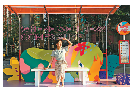
「站」在家門前，配上寓意健康生活好地方的霓虹標語。