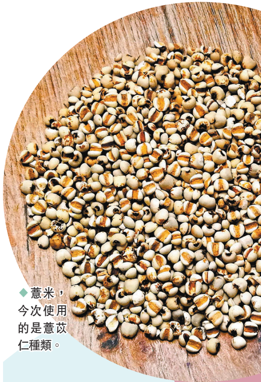
薏米，今次使用的是薏苡仁種類。