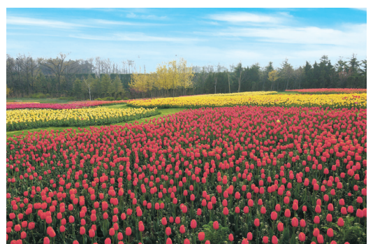
◆英歌石植物園共栽種100多萬株鬱金香。

與鬱金香花田一樣，芝櫻大花海也是中國著名的春季網紅打卡地。記者了解到，如雲霞飛落的芝櫻大花海已開始絢爛綻放，一整面山坡粉艷芬芳，醉人心魄。