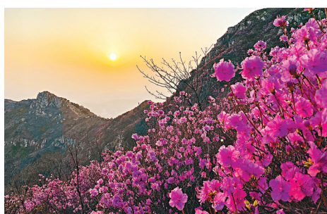
◆朝陽下的杜鵑花海美不勝收。