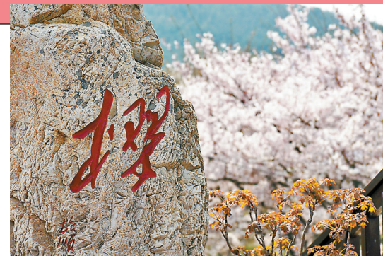
◆旅順櫻花園是東北最大的櫻花園。