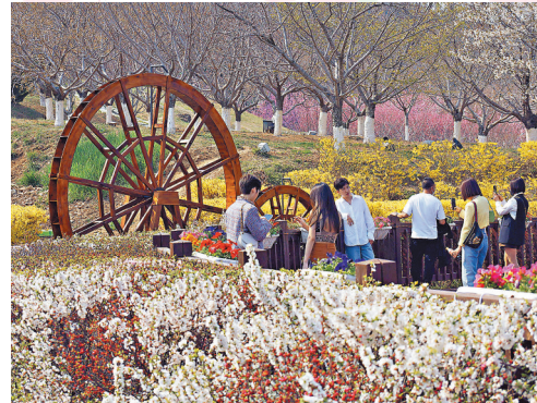
◆遊客在水車前打卡。

人間最美四月天，不負春光與時行。近日，位於遼東半島最南端的遼寧大連也迎來最美賞花季。從遼南第一山的大黑山野生杜鵑花海，到被譽為「中國最美春季花園」的英歌石植物園鬱金香花田，再到東北面積最大、數量最多、品種最全的旅順櫻花園……山花爛漫、櫻花盛開，吸引不少市民走出家門親近自然，遊人踏青賞花，不負春光。