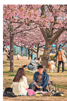
◆市民坐着欣賞櫻花。

日本東京晴空塔應該很多港人都去過，早前東京氣溫漸暖，櫻花綻放，讓晴空塔周邊的櫻花開得燦爛，在櫻花映照下的晴空塔更美，而附近的舊中川沿岸也拍到綻放的櫻花，不少市民坐着乘涼欣賞。這座東京晴空塔，又譯稱東京天空樹、新東京鐵塔，是位於東京都墨田區的電波塔，其高度為634公尺，於2011年獲得金氏世界紀錄認證為「世界第一高塔」，成為全世界最高的塔式建築，目前亦為世界第二高的人工構造物，僅次於哈里發塔。