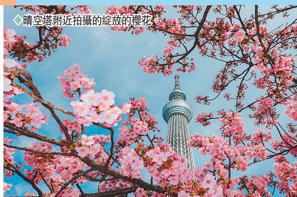
◆晴空塔附近拍攝的綻放的櫻花。

日本東京晴空塔應該很多港人都去過，早前東京氣溫漸暖，櫻花綻放，讓晴空塔周邊的櫻花開得燦爛，在櫻花映照下的晴空塔更美，而附近的舊中川沿岸也拍到綻放的櫻花，不少市民坐着乘涼欣賞。這座東京晴空塔，又譯稱東京天空樹、新東京鐵塔，是位於東京都墨田區的電波塔，其高度為634公尺，於2011年獲得金氏世界紀錄認證為「世界第一高塔」，成為全世界最高的塔式建築，目前亦為世界第二高的人工構造物，僅次於哈里發塔。