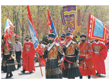
◆身着明制漢服的表演者衣袂翩翩。

為創建東亞文化之都，滿足遊客多元文化需求，旅順櫻花園還舉辦了非遺文化展演、漢服遊園互動等多項活動。記者在現場看到，隨着一陣傳統宮廷音樂響起，近40名穿着明制漢服的表演者，衣袂翩翩，步履輕盈地巡遊在旅順櫻花園動漫大道，吸引了眾多遊客目光。巡遊後，部分表演者還在櫻花園的中心廣場、梅園廣場等位置進行了古典舞蹈、傳統武術表演。羽衣霓裳，綺羅長袖翩翩起舞；時光倒