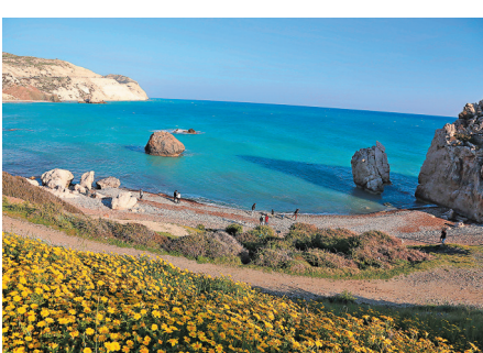
◆人們在塞浦路斯帕福斯的「愛神石」景區遊覽。

在古典時期，帕福斯可指舊帕福斯與新帕福斯，目前大部分居民居住於新帕福斯，而帕福斯則被聯合國教科文組織列為世界遺產。早前，不少遊客到帕福斯的「愛神石」景區遊覽，藉以探訪「愛神」誕生的地方。