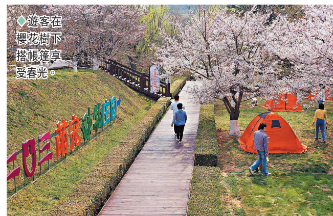
◆遊客在櫻花樹下搭帳篷享受春光。