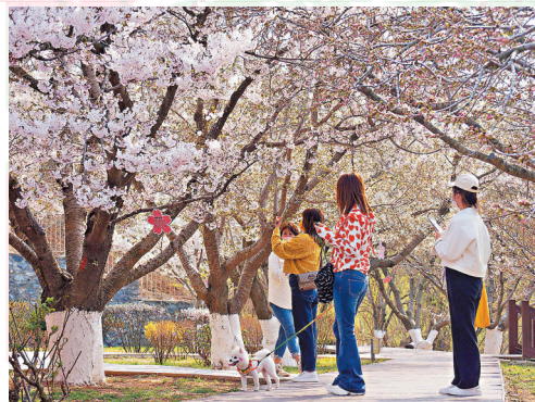
◆染井吉野櫻花盛開，吸引遊客打卡。