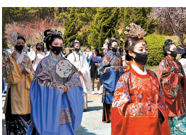
◆漢服遊園吸引遊客拍照。

為創建東亞文化之都，滿足遊客多元文化需求，旅順櫻花園還舉辦了非遺文化展演、漢服遊園互動等多項活動。記者在現場看到，隨着一陣傳統宮廷音樂響起，近40名穿着明制漢服的表演者，衣袂翩翩，步履輕盈地巡遊在旅順櫻花園動漫大道，吸引了眾多遊客目光。巡遊後，部分表演者還在櫻花園的中心廣場、梅園廣場等位置進行了古典舞蹈、傳統武術表演。羽衣霓裳，綺羅長袖翩翩起舞；時光倒