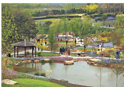
◆亭台水榭一步一景。

而在距離大黑山西南40餘公里，被譽為「中國最美春季花園」的大連英歌石植物園也迎來客流高峰，「聞名全國的鬱金香花田、芝櫻大花海正值盛花期。此外，桃花、櫻花、海棠花、紫荊花等也都集中盛開……現在正是最美的時候。」英歌石植物園創始人孫洪奎表示。