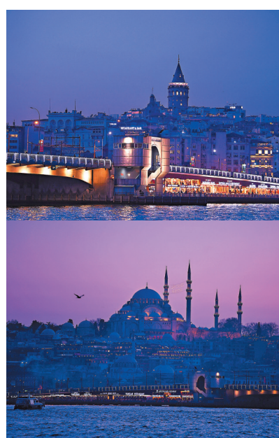
◆在落日餘暉下拍攝的土耳其伊斯坦堡城市風光。

日前，落日餘暉下的土耳其伊斯坦堡的城市風光璀璨，伊斯坦堡是土耳其最大城市，亦是該國的經濟、文化和歷史中心。它坐落於土耳其西北部的博斯普魯斯海峽（伊斯坦堡海峽）之濱，不少遊客到博斯普魯斯海峽乘船遊玩。博斯普魯斯海峽北連黑海，南通馬爾馬拉海，土耳其第一大城伊斯坦堡即隔著博斯普魯斯海峽與小亞細亞半島相望，是黑海沿岸國家出海第一關口，也是連接黑海以及地中海的唯一航道。