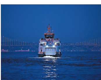
◆遊客在博斯普魯斯海峽乘船遊玩。