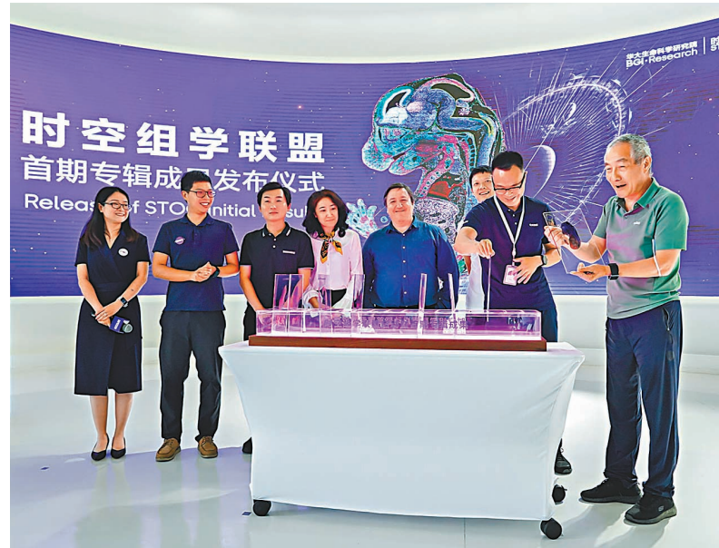
◆時空組學聯盟研究成果發布儀式。