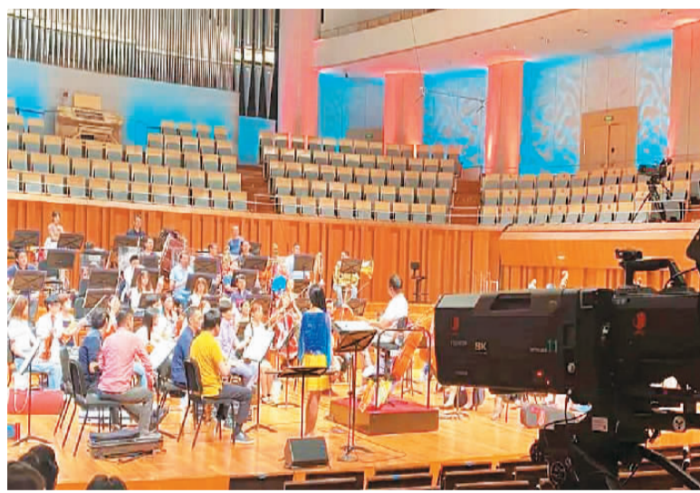
国家大剧院正以线上直播的方式呈现一场音乐会。