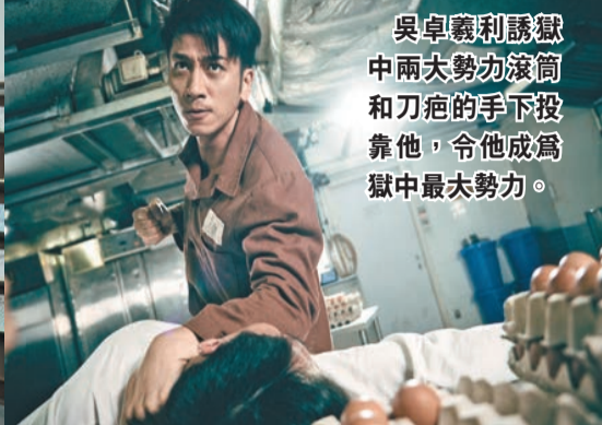
吳卓羲利誘獄中兩大勢力滾筒和刀疤的手下投靠他，令他成為獄中最大勢力。