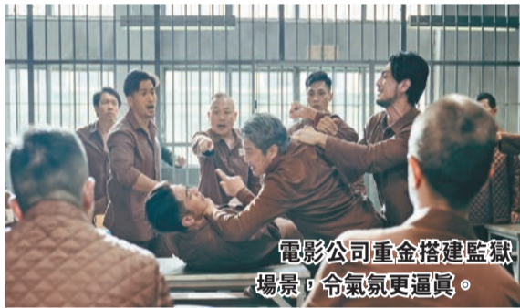
電影公司重金搭建監獄場景，令氣氛更逼真。