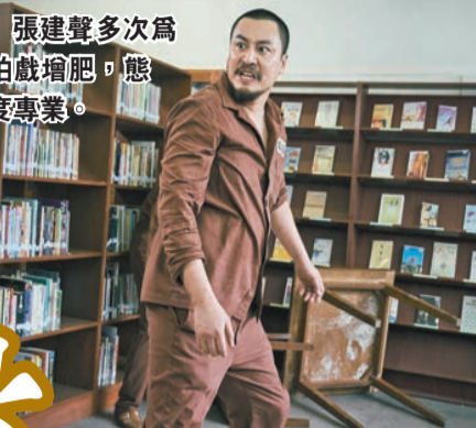
張建聲多次為拍戲增肥，態度專業。