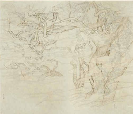
陳鈞樂作品《霧》，137×172 厘米，2021年。