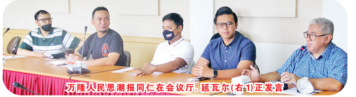
万隆人民思潮报同仁在会议厅, 延瓦尔(右1)正发言