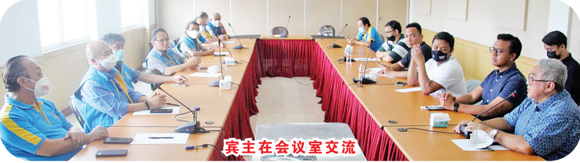
宾主在会议室交流