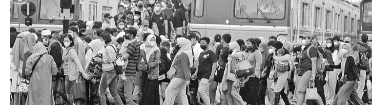
茂物列车站人山人海 根据印尼铁路公司的记录报告,在解禁节第二天,乘搭通勤电动列车的乘客达到39万5266人,其中前往茂物的人数竟达到4万1662人为最多。

年,新国都所需的建设资金总额约达466万亿盾,其中90.4万亿盾取自国家预算案,123.2万亿盾由私营企业负责承担,252.5万亿盾通过公私合作进行融资。毕玛补充说,如果通过国家债务或发行债券进行融资,国家预算案便面临重大压力,如今国家预算案正面临通货膨胀的挑战,不论能源、粮食或社会都会需要政府提供津贴或援助,还有控制价格的预算也不小。