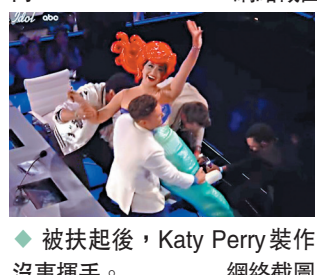
◆被扶起後，Katy Perry裝作沒事揮手。