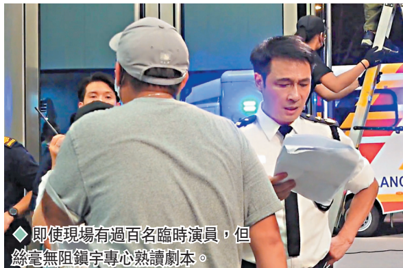
◆即使現場有過百名臨時演員，但絲毫無阻鎮宇專心熟讀劇本。