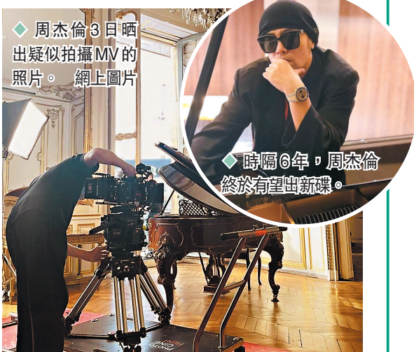
◆周杰倫3日晒出疑似拍攝MV的照片。

時隔6年，周董終於有望出新碟，歌迷們即時沸騰起來，該貼文1小時吸引逾6萬人按讚，有歌迷開心留言「真的信」、「哥說現在發我也信」，但也有不少歌迷抱持懷疑態度表示「好消息：周杰倫說六七月發專輯，壞消息：沒說哪一年」、「不信，除非發出來看看」。對於新專輯的發行計劃，周董所屬的唱片公司杰威爾則回應「籌備中」。