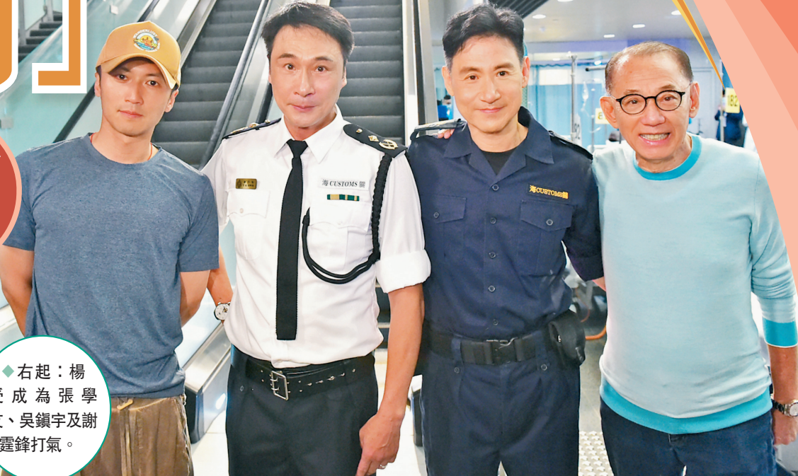
◆右起：楊受成為張學友、吳鎮宇及謝霆鋒打氣。

香港文匯報訊(記者 梁靜儀)邱禮濤執導的英皇電影《海關戰線》，拍攝進入如火如荼階段，英皇集團主席楊受成博士專程前往拍攝現場探班，向張學友、謝霆鋒、林嘉欣、劉雅瑟等幾位主角及特別演出的吳鎮宇打氣，同時為新人黎峻慶祝生日，現場演員還有石修、衛詩雅、關智斌、楊天宇及朱天等。影帝級人馬吳鎮宇表示，望能與新導演合作，更公開呼籲大家找他拍戲，強調自己的片酬「抵用」。