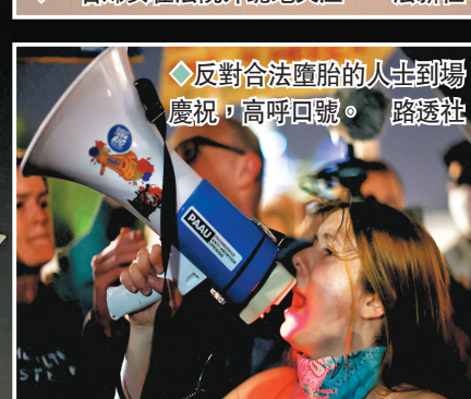
◆反對合法墮胎的人士到場慶祝，高呼口號。