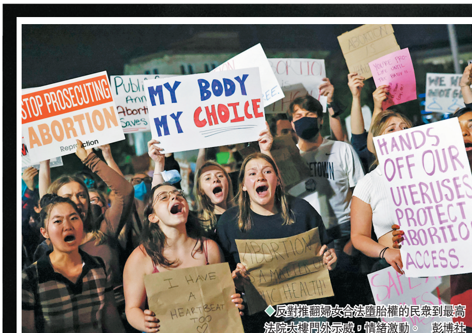
反對推翻婦女合法墮胎權的民眾到最高法院大樓門外示威，情緒激動。