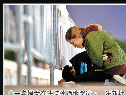
◆一名婦女在法院外跪地哭泣。