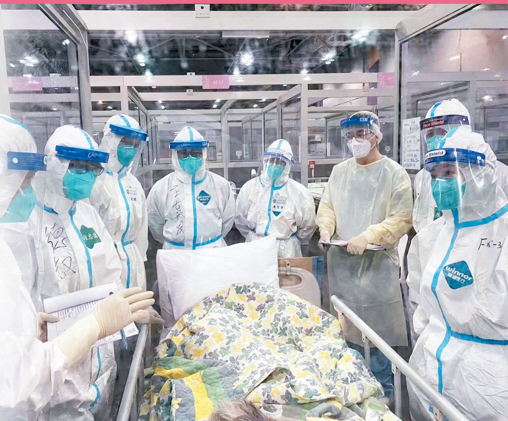
◆內地援港醫療隊隊員難忘與香港醫護站在抗疫一線，共同診治病患。