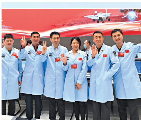
◆祝融號設計團隊35歲以下成員佔七成。圖為2021年5月15日航天科研人員在北京航天飛行控制中心慶祝我國首次火星探測任務著陸成功。

2021年6月，天問一號火星探測器總體設計師孫澤洲曾在香港大學作《「天問一號」的探「火」之路》的主題報告。「可