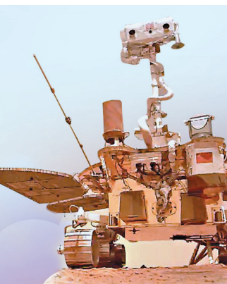
◆祝融號火星車在火星上留下了屬於中國的印記。

以說，我們的天問一號、航天事業，為年輕人提供了很好的機會和平台，年輕人可以去展示才華、實現夢想，孫澤洲說，青年人已經成為推動航天事業發展的有生力量和中堅力量，航天事業的迅猛發展也為青年提供了自我成長的舞臺和機會。