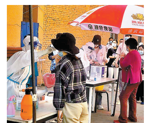
◆5月3日至5日，北京12區再次連續開展三輪區域核酸篩查。

此外，北京市要求，從5月5日起，所有進航站樓人員須提供7日內核酸檢測陰性證明，使用「北京健康寶」掃碼登記並通過體溫檢測方可進入。