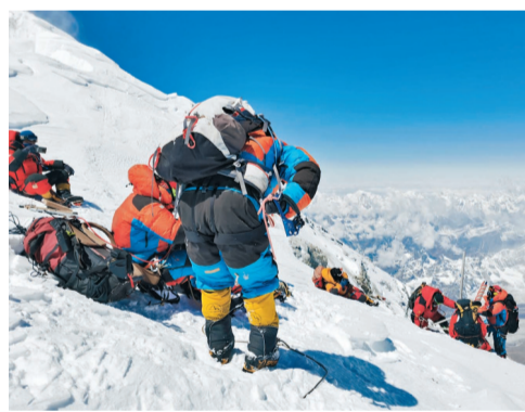
◆科考隊員在珠峰成功架設世界海拔最高的自動氣象站。