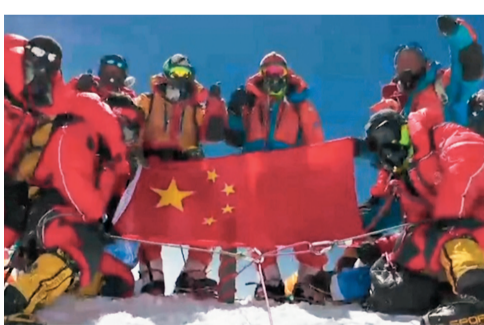
◆「巔峰使命2022」珠峰科考登頂隊員在珠峰峰頂展示五星紅旗。

隨着全球變暖，青藏高原地區呈現海拔越高升溫幅度越大的特徵。趙華標說，這種現象是基於海拔5,000米以下的氣象站觀測得出的結論，但在更高海拔層面沒有氣象實測數據，只是根據遙感數據推算。為填補這一空白，第二次青藏高原科考隊確定在珠峰北側布局8個自動氣象站。它們呈階梯分布，通過收集氣象數據研究極高海拔的氣象要素變化特徵。這些自動氣象站中，海拔5,200米的氣象站是通過4G網絡實現數據傳送，其他是通過衛星傳輸即時數據。