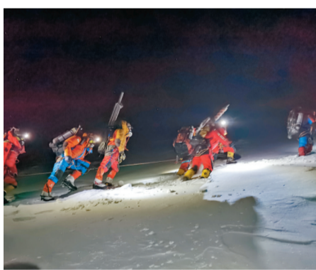
◆5月4日凌晨，珠峰科考隊員從突擊營地出發，向珠穆朗瑪峰頂發起衝刺。

中科院青藏高原研究所研究員趙華標介紹，今年以來，科考隊已陸續在海拔5,200米、7,028米、7,790米和8,300米架設了四個自動氣象站。加上去年架設的6,500米、5,800米及5,400米三個自動氣象站，一個從海拔5,200米至海拔8,300米之間的7