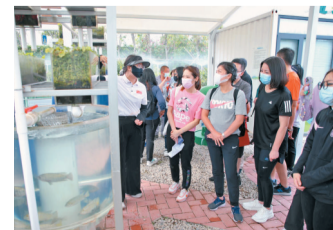
◆「澳門青年實習計劃」助澳門培養更多優質人才。圖為澳門青年近日在橫琴體驗綠色低碳活動。

同時，實習活動將為參與實習的澳門籍青年提供全方位的服務保障，安排和管理實習生的食、宿、保險等事宜，實習企業將根據當地工資標準發放實習工資。