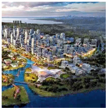
◆深珠通道珠海落腳點位於「深珠合作示範區」。圖為合作示範區設計效果圖。

據了解，港珠澳大橋建設之前曾出現「單Y」（一橋連港珠澳）與「雙Y」（一橋連港深珠澳）方案的討論，廣東方面希望「一橋連四地」，在港珠澳大橋確定「單Y」方案後，深珠之間的通道連接備受矚目。廣東省政府去年發布《廣東省綜合交通運輸體系「十四五」發展規劃》，提出「研究深圳經港珠澳大橋至珠海、澳門通道」，一度引發港珠澳大橋「單Y」變「雙Y」的熱議。但廣東交通相關部門負責人3日受訪時透露，目前仍屬於提出研究的階段，而且其可行性或線路仍要待粵港澳三方進一步研究磋商。