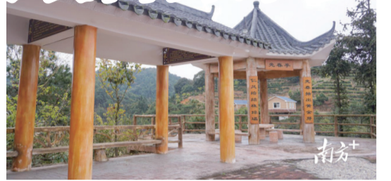
西岩萬畝茶文化產業園的文化長廊