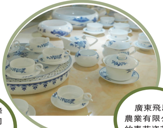
廣東飛馬峰農業有限公司的青花瓷茶具