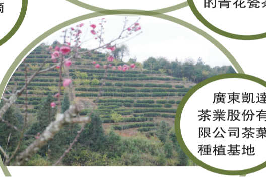
廣東凱達茶業股份有限公司茶葉種植基地