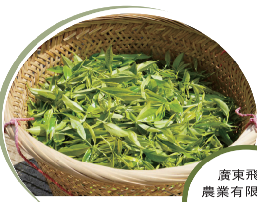
廣東飛馬峰農業有限公司採茶工剛採摘下來的茶葉