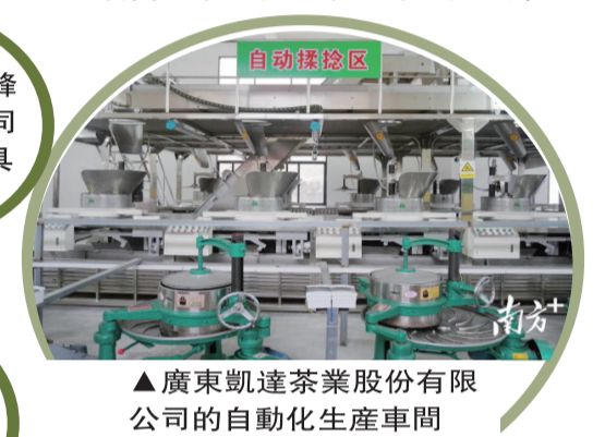
▲廣東凱達茶業股份有限公司的自動化生產車間

據史志記載，唐代末期大埔已種植生產茶葉，距今超千年歷史。至明朝，茶園遍布全縣。西岩山常年雲霧繚繞，空氣富含負氧離子，土壤含富硒，是發展高香型優質有機茶的理想之地，也是大埔烏龍茶的主產區。