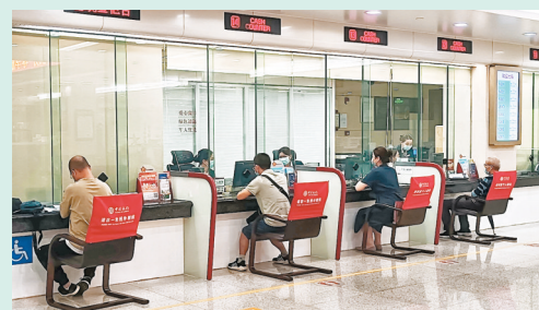
◆ 圖為中行深圳分行客戶在辦理業務。

去年深圳進出口總額達3.54萬億元，外貿出口連續29年高居內地第一。作為外貿十分發達的城市，加上鄰近香港和東南亞，深圳企業跨境人民幣結算需求巨大。中國人民銀行深圳中心支行有關負責人告訴記者，試點鼓勵銀行對守法自律、實體經營的優質企業，提供更加便利的跨境人民幣結算服務。銀行可在「展業三原則」的基礎上，憑優質企業提交的收付款指令，直接為優質企業辦理貨物貿易、服務貿易跨境人民幣結算，以及資本項目人民幣收入(包括外商直接投資本金、跨境融資及境外上市募集資金調回等)在境內的依法合規使用，無須事前、逐筆提交交易真實性證明材料。截至2022年3月31日，深圳共有18家銀行、643家企業參與試點，累計試點金額1,669.3億元。