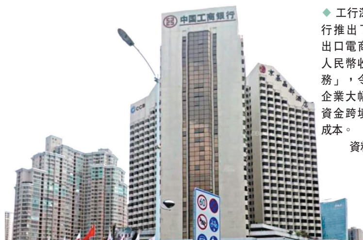
◆ 工行深圳分行推出了「AI出口電商跨境人民幣收款服務」，令出口企業大幅降低資金跨境回款成本。

工行深圳分行2017年開始探索出口電商跨境收款服務創新，推出「基於人工智能的出口電商跨境人民幣收款服務」，完善了與出口電商跨境收款業務配套的金融支持。該服務基於大數據、機器學習、自然