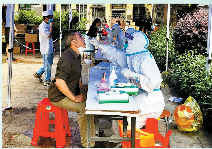
◆廣州越秀區珠光街採樣現場。

「五一」假期將至，不少市民已經安排好出行計劃，突如其來的疫情會否打亂出行計劃，大家十分關心。「如果防疫行程卡出現『星號』，我應該會取消行程。疫情反覆，確實給我們帶來了不少困擾。」市民陳先生說。