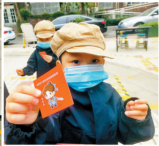
▲濟南本月27至30日核檢檢測貼紙圖案為卡通版辛棄疾。