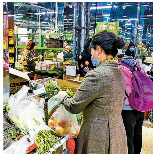
◆長春市疫情進入封控管區清零階段。圖為長春市一超市內，市民選購蔬菜。

三是繼續呈現多點多源多鏈的複雜局面。多個省份的疫情傳播鏈條多，既有外省溢入疫情，也有本地源頭不清的傳播疫情，增加了疫情防控的複雜性和艱巨性。目前，河北、江蘇、浙江、遼寧、安徽、江西、北京等省市疫情處置積極有效。吉林省疫情呈持續下降態勢，吉林省疫情已進入隔離點陽性清零階段，長春市疫情進入封控管區清零階段。上海市疫情整體呈現明顯下降趨勢，社會面疫情風險正逐步降低，但防控形勢依然嚴峻，防反彈防外溢任務十分艱巨。