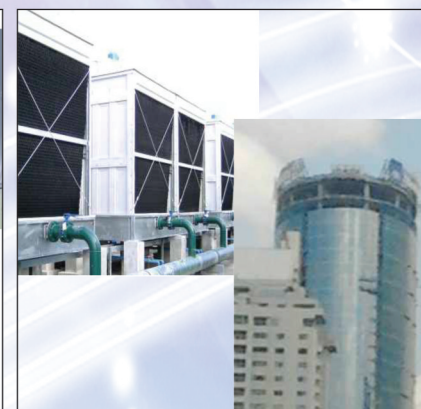
Terminal 3 Soekarno Hatta project