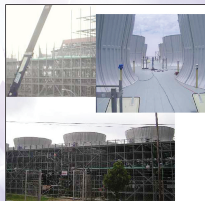
Wayang Windu Geothermal #2 project 2008 (FRP Tower)