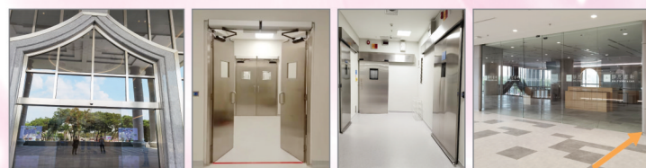
Tzu Chi Hospital

ASSA ABLOY Automatic Door Operator (Sweden)