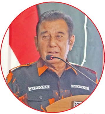
Japto SS 主席致词