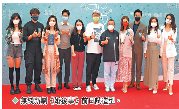
◆無線新劇《婚後事》前日試造型。