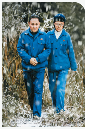
◆《鄧小平小道》已於內地公映。

香港國際電影節協會總監利雅博表示:「吳君如一直敢於挑戰不同角色,由豁達妓女、黑幫首領以至慈愛母親,以細膩演技呈現平凡人物的非凡層次。她在演藝事業的蛻變,見證着香港主流電影工業的更迭起伏,憑女性觸覺及個人意志自創新天地,成為華人地區最具影響力的女星之一。我們很榮幸能夠邀請她成為第46屆香港國際電影節的焦點影人。」