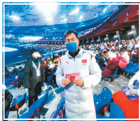
谢海山在北京冬残奥会开幕式现场。