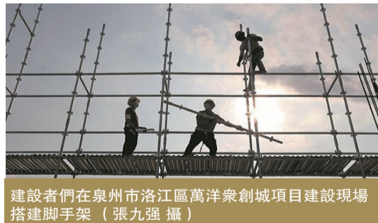
建設者們在泉州市洛江區萬洋衆創城項目建設現場搭建腳手架