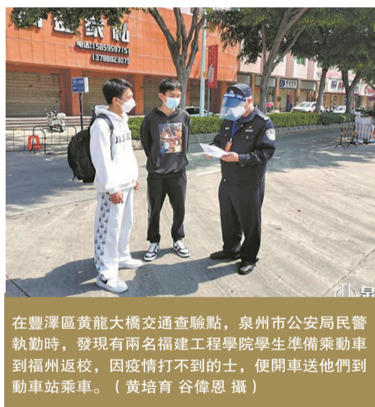
在豐澤區黃龍大橋交通查驗點，泉州市公安局民警執勤時，發現有兩名福建工程學院學生準備乘動車到福州返校，因疫情打不到的士，便開車送他們到動車站乘車。