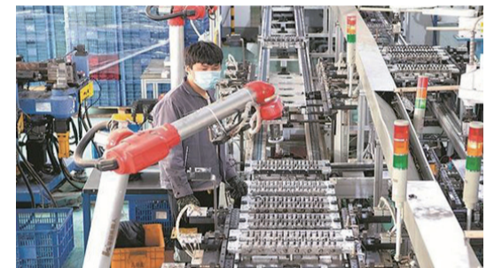
在南安市高斯康實業有限公司汽車安保配件的生產線上，技術員在調試機械手臂。