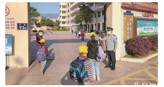
安溪縣湖頭鎮第三中心小學學生有序在校門口排隊測量體溫進校