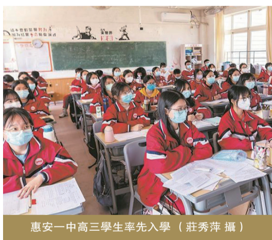
惠安一中高三學生率先入學