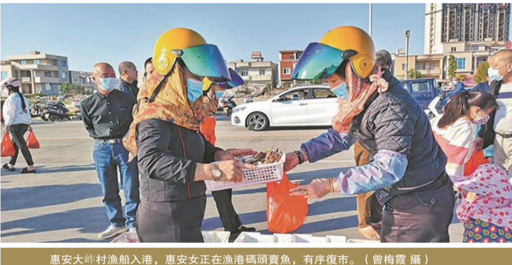
惠安大嶼村漁船入港，惠安女正在漁港碼頭賣魚，有序復市。