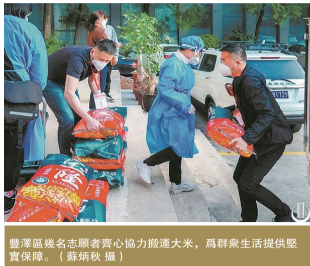
豐澤區幾名志願者齊心協力搬運大米，為群衆生活提供堅實保障。