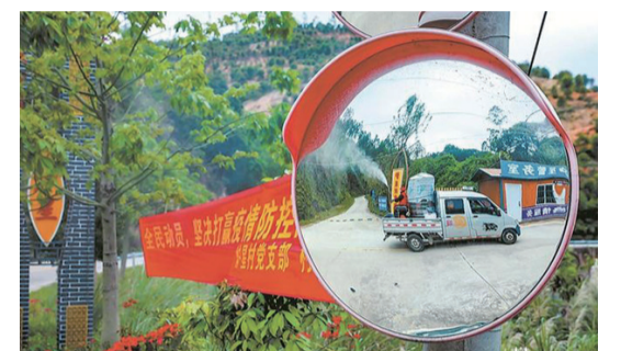
南安市樂峰鎮防疫消毒車開進鄉村進行消毒