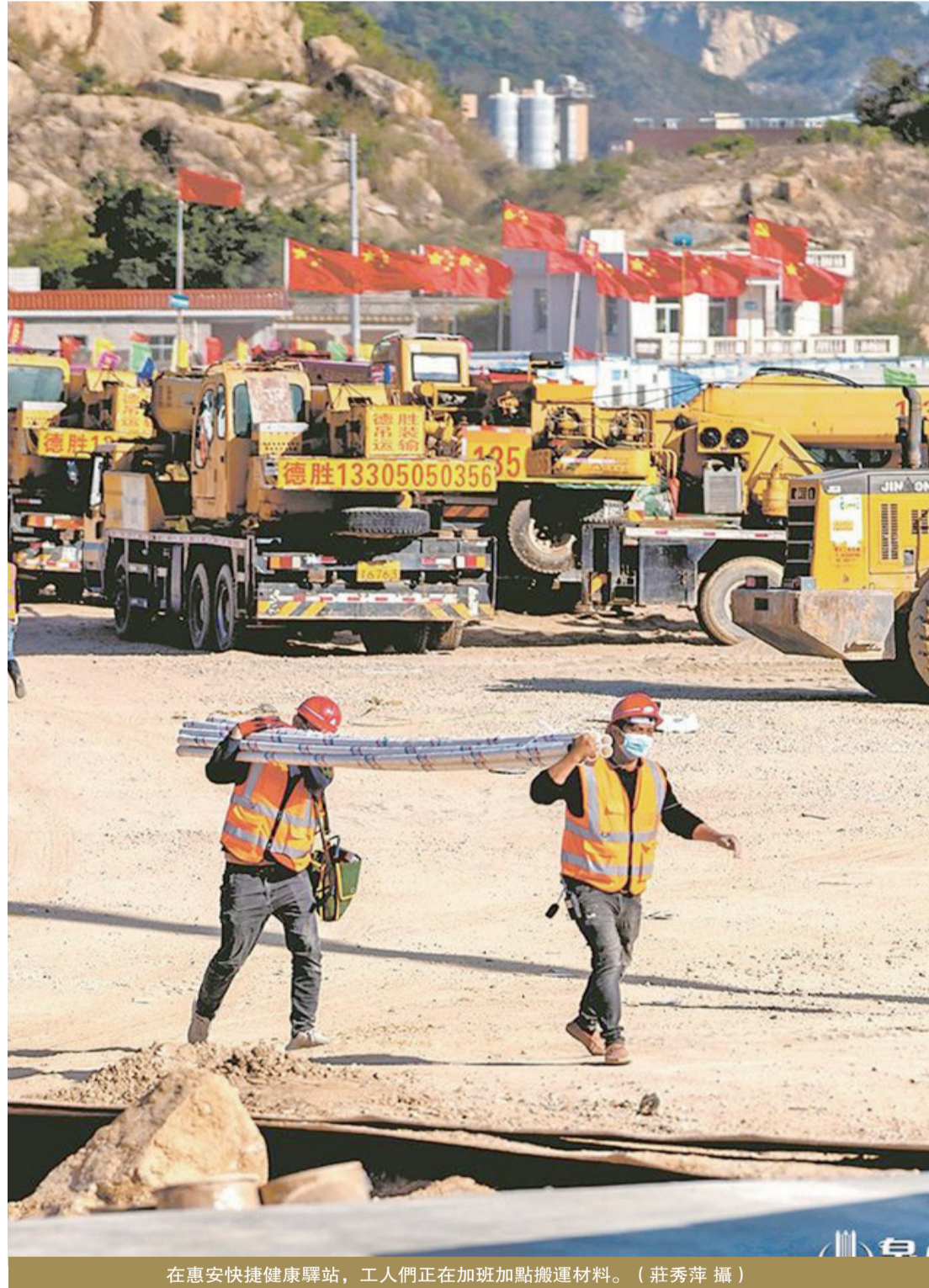
在惠安快捷健康驛站，工人們正在加班加點搬運材料。