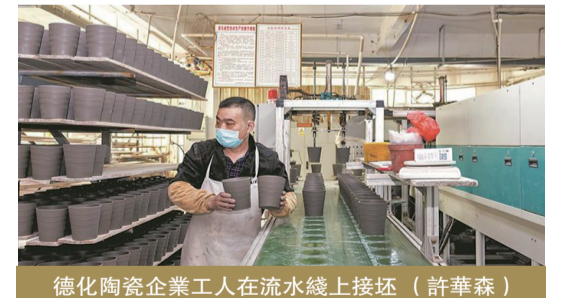
德化陶瓷企業工人在流水線上接坯