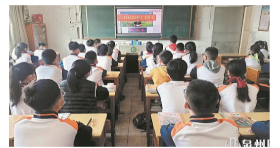
安溪縣實驗小學舉行復學第一課，對學生心理進行引導教育。