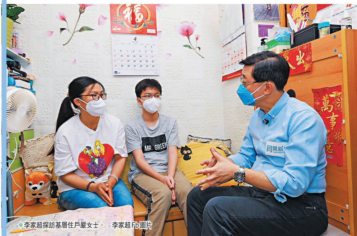
◆ 李家超探訪基層住戶嚴女士。

李家超24日早上先到油麻地探訪兩戶基層家庭，實地了解市民的生活處境，並在活動後向傳媒簡述情況，以及在Facebook上發帖分享。