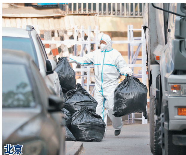
北京 北京市24日起將朝陽區潘家園街道松榆里社區定為高風險地區。圖為社區工作人員身穿防護服在轉運居民生活垃圾。