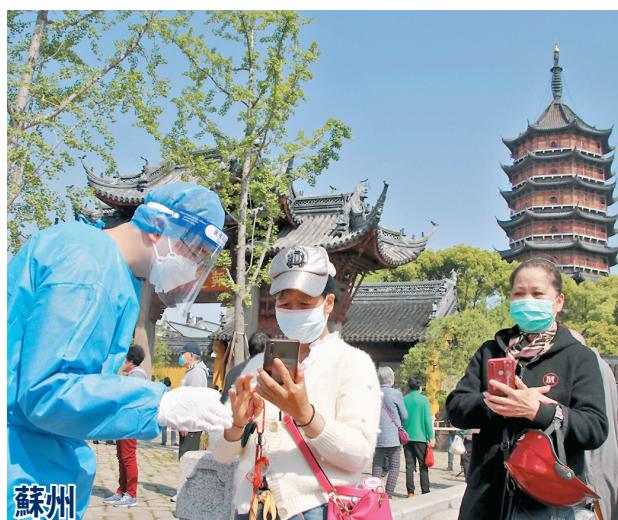
蘇州 市民在江蘇蘇州市姑蘇區平江街道北寺塔核酸檢測點有序參加核酸檢測採樣。