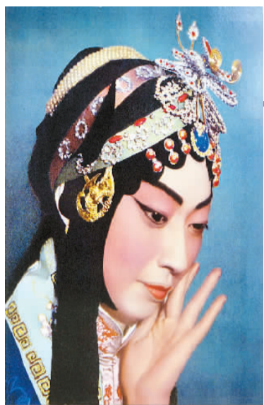
▲梅兰芳剧照

1930年2月17日，纽约百老汇四十九街戏院，梅兰芳访美首场演出正式拉开帷幕。当日，《纽约世界报》发表评论道：“梅兰芳在舞台上出现三分钟，你就会承认他是你所见到的一位最杰出的演员。演员、歌唱家和舞蹈家，三位一体，结合得那样紧密无间，你简直看不出这三种艺术相互之间存在什么界限，这在京剧里确实是浑然一体而不可分解的。”