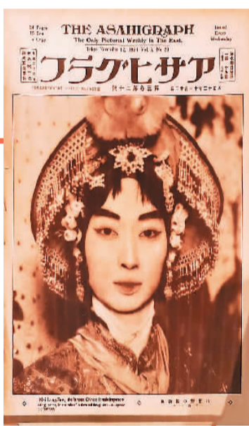
▲日本《朝日画报》刊登的梅兰芳赴日演出海报

人们常说，越是民族的越是世界的。不同历史和国情，不同民族和习俗，孕育了不同文明，使世界更加丰富多彩。作为文明古国，中国有5000年灿烂辉煌的历史，绵延不绝，形成独特的中华文化思想体系。京剧根植于传统文化沃土，有着深厚的文化底蕴。梅兰芳的艺术不仅是语言、声音、身段、舞蹈层面的，更是思想和精神层面的。他所接受的启蒙教育和学戏技艺，都打上传统深深的烙印。对传统，他有着比一般人更深的理解和热爱。