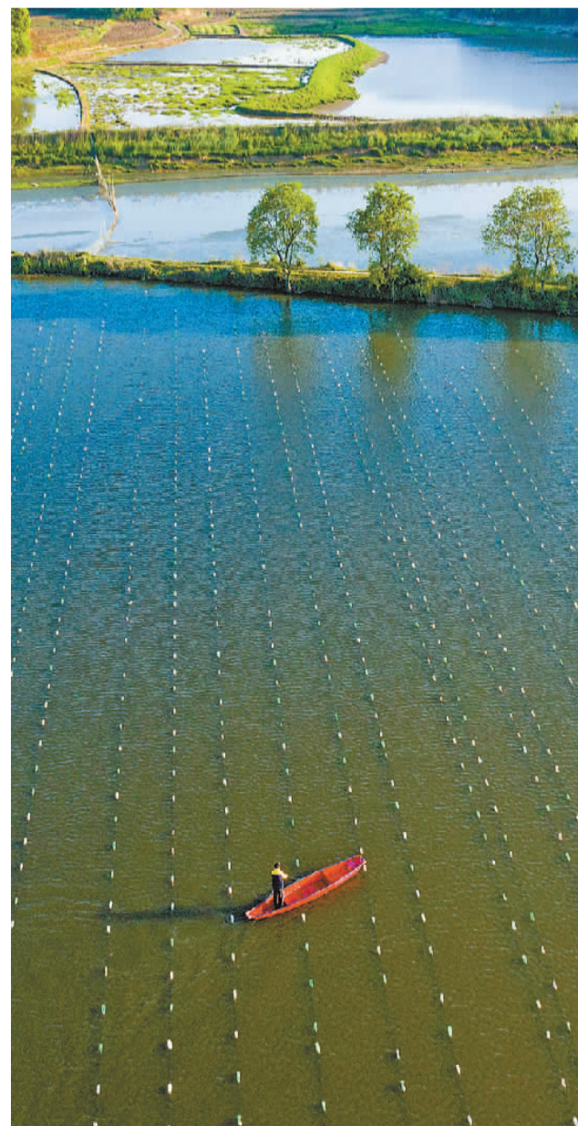
眼下正是种珍珠蚌的好时节，在江西省九江市都昌县新妙湖畔的珍珠养殖基地，蚌农忙着科学种蚌。图为4月23日，蚌农泛舟湖上管理珍珠蚌。

“我所做的都是很小的事情，例如帮忙搬运物资，做翻译，联络沟通……但在身处困难的人眼中，这些都是大事。”哈比说，“一个安全宜居的城市需要住在这里的每个人都付出努力。我们虽然是‘老外’，但不是外人。”