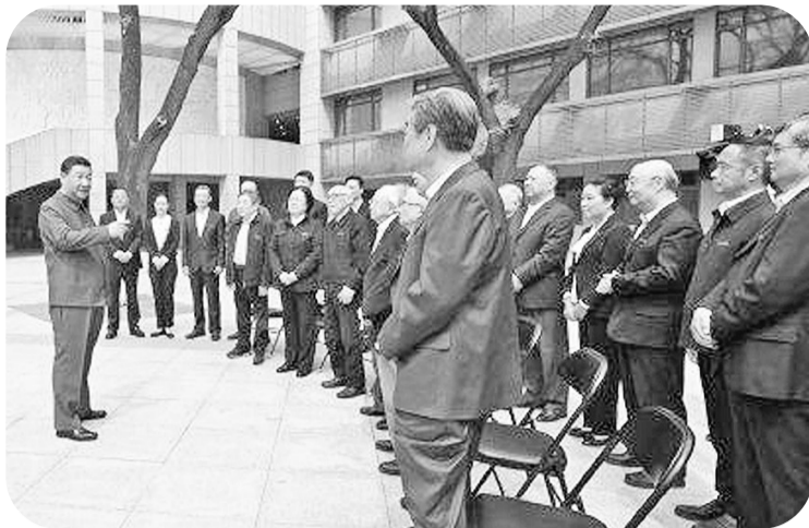
历史沿革、教学科研成果、加强文献古籍保护利用和促进理论研究成果转化应用等情况,并主持召开师生代表座谈会。(文字记者:张晓松;摄影记者:燕雁、谢环弛)