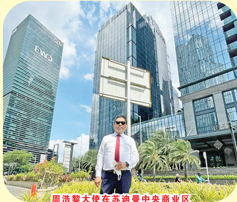
周浩黎大使在苏迪曼中央商业区