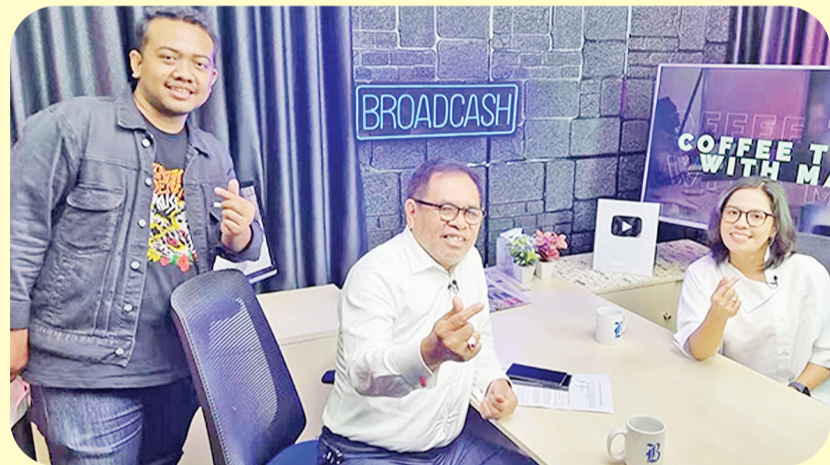
周浩黎大使接受印尼商业电台的采访