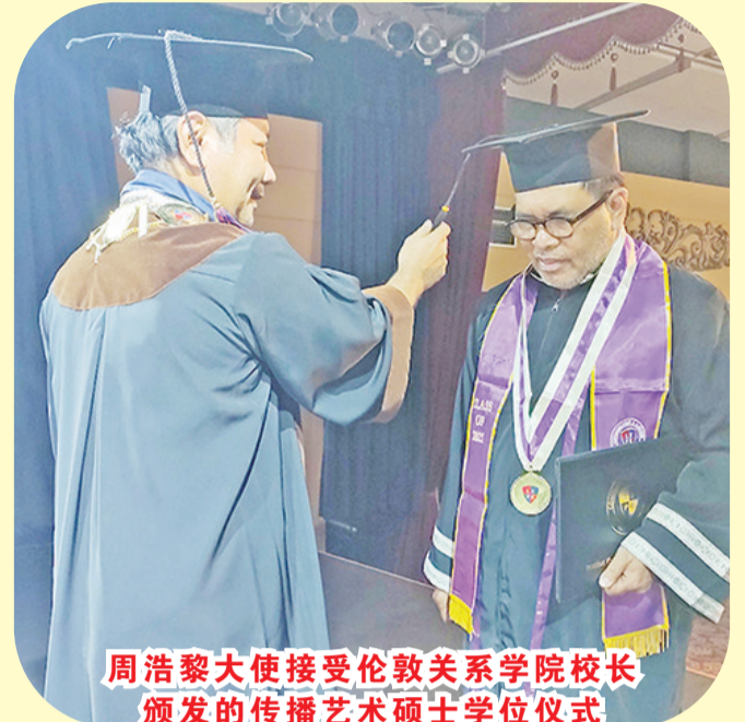
周浩黎大使接受伦敦关系学院校长颁发的传播艺术硕士学位仪式