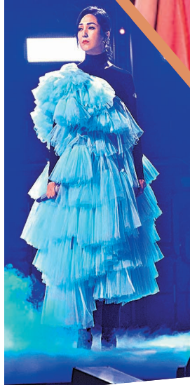
◆楊千嬅指《無條件》這首歌陪伴自己走過低潮。