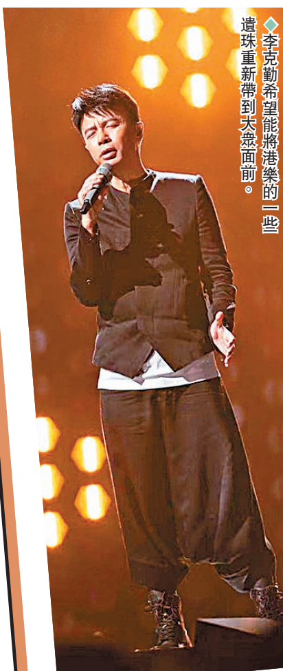
◆李克勤希望能將港樂的一些遺珠重新帶到大眾面前。