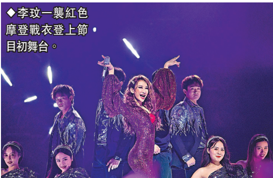
◆李玟一襲紅色摩登戰衣登上節目初舞台。

香港文匯報訊(記者胡若璋廣州報道)總有一首港樂道破心境!《聲生不息·港樂季》今日首播,黃金陣容再唱響港樂。林子祥、葉蒨文、李克勤、楊千嬅、李健、李玟、林曉峰、周筆暢、劉惜君、毛不易、曾比特、炎明熹等歌手分為男隊、女隊兩大陣營,改編演唱港樂金曲,還將與觀眾共創一張「聲生不息」港樂時代唱片。據悉,這張唱片將全線發布並進行實體售賣和數字音樂下載銷售。